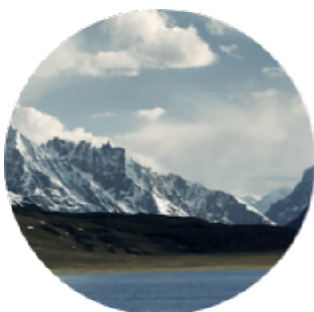
La M arche