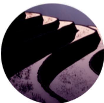
Les L ieux M ythiques