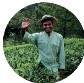
La R encontre