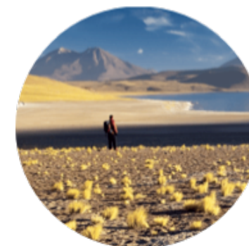
Les G randes E spaces