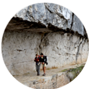
L' E xploration