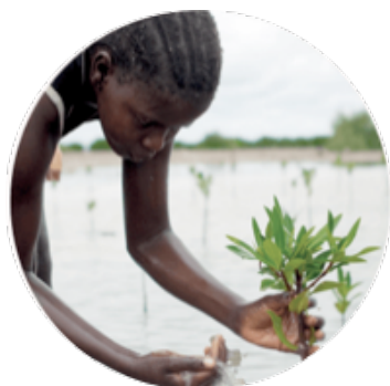
L' É cologie